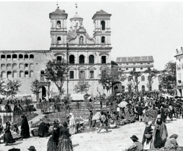
Población en la plaza de Santo Domingo de Murcia a principios del siglo xx.